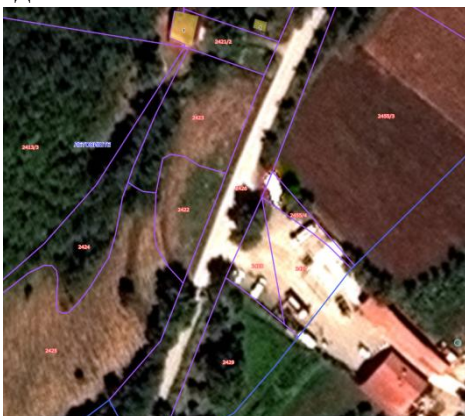
Извод из ГеоСрбије

Катастарске парцеле број 2427 и 2428 обе КО Летовиште за које се издају локацијски услови налази се у селу Летовиште-Општина Владичин Хан које представља примарно сеоско насеље, а парцела 2428 има директан приступ на кп.бр. 2426 КО Летовиште која представља општински пут у јавној својини Општине Владичин Хан.